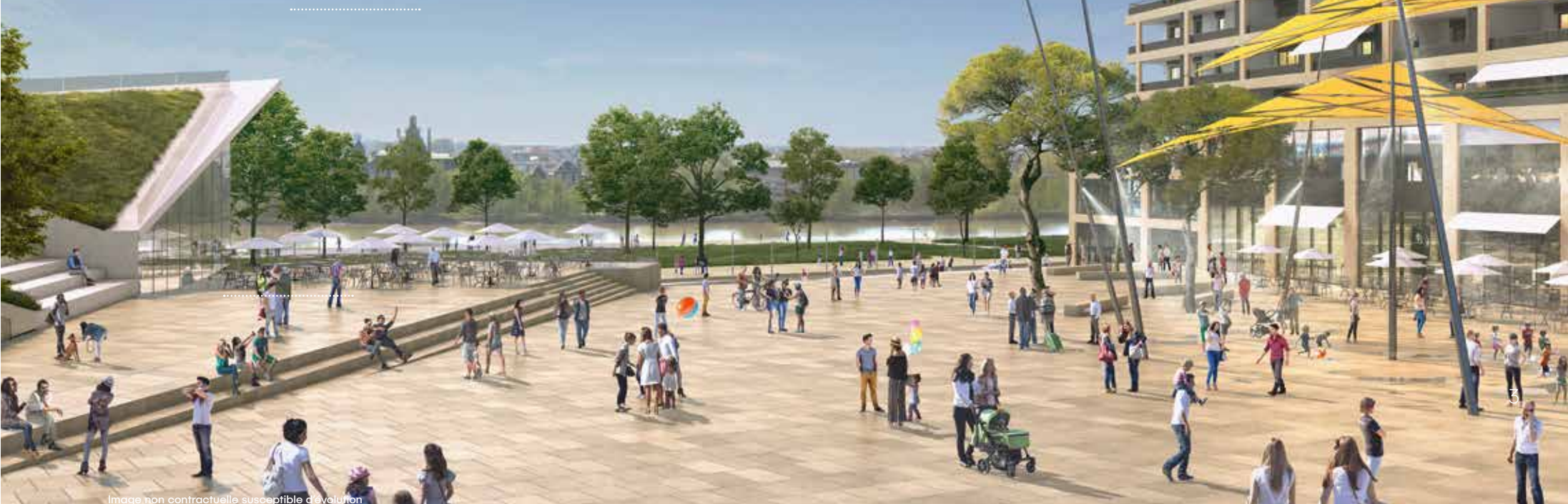
Image non contractuelle susceptible d'évolution

↑ L'esplanade Belvédère offre une vue privilégiée sur la Garonne et la rive gauche.